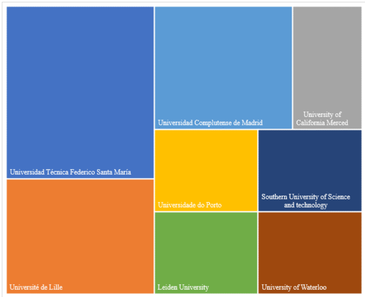
Figura 4. Instituciones en donde nuestros estudiantes de doctorado hicieron estancias de investigación

Otra actividad de primera importancia que surge de colaboración entre instituciones académicas es la movilidad de estudiantes. Estas estancias de investigación, sin lugar a dudas, ayudan a complementar la formación académica y cultural de los estudiantes. En nuestro posgrado, alentamos a nuestros estudiantes a hacer estancias de investigación en instituciones extranjeras, generalmente bajo la responsabilidad de un colaborador del director de tesis. Como se muestra en la Figura 4, en total, nuestros estudiantes de doctorado realizaron 12 estancias de investigación en ocho instituciones en el extranjero localizadas en Chile, Francia, Estados Unidos de América, Portugal, España, Países Bajos, China y Canadá.